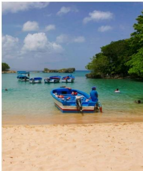
Costa Esmeralda Tour Privado desde Santo Domingo