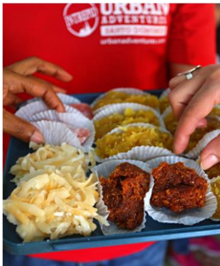
Sitios, sonidos y sabores de Santo Domingo