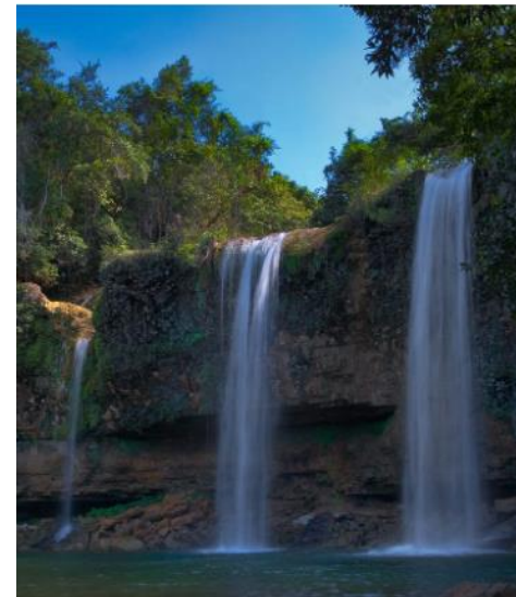
Monte Plata. Tour Privado desde Santo Domingo